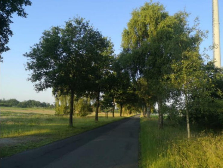
Abb. 3: Straße (OVS) mit begleitender Baumreihe (HBA) (Eigene Aufnahme vom 12.06.2025)

einer (Strauch-)Baumhecke (HFB, HFM) begleitet wird. Darunter befindet sich eine halbruderale Gras- und Staudenflur (UHM) und eine Ackerfläche (AS). Im Süden begrenzt werden diese wieder durch einen Feldweg (OVW) mit begleitender Baumreihe (HBA) und Strauch-Baumhecke (HFM).