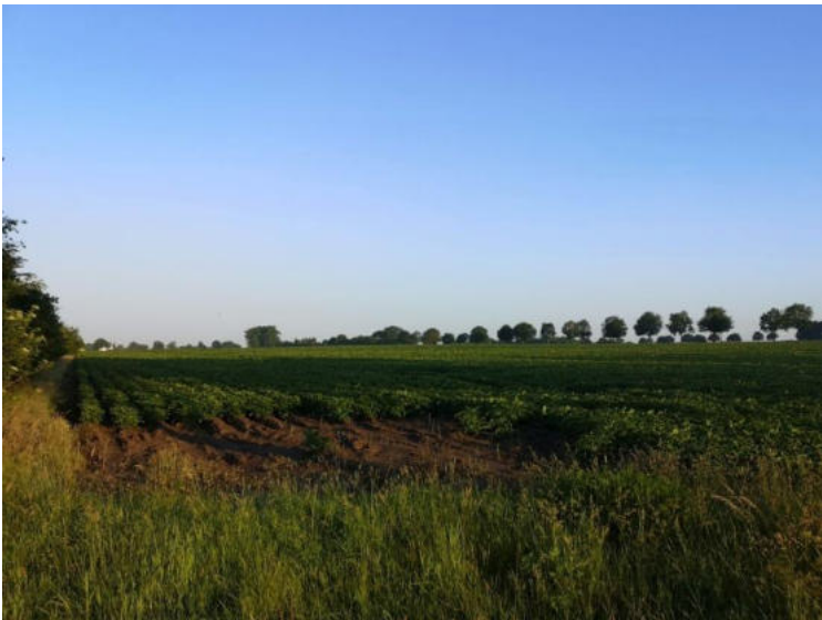
Abb. 2: Sandacker (AS) (Eigene Aufnahme vom 12.06.2025)

Der Vorhabenbereich selbst besteht maßgeblich aus einem Sandacker (AS) (s. Abb. 2). Im Westen befindet sich ein naturnahes Feldgehölz (HN) und ein Funkturm (OT), welche vom Vorhaben unberührt bleiben. Im Norden wird das Plangebiet durch eine Straße (OVS) mit einer begleitenden Baumreihe (HBA) begrenzt. Nördlich der Straße befinden sich zwei weitere Ackerflächen (AS), die durch einen Streifen, der zu dem Biotoptyp Baumschule gehört (EBB), voneinander getrennt sind. An die Ackerfläche grenzt ein Bereich mit einer Grünland-Einsaat (GA), eine Baumreihe (HBA) und ein Intensivgrünland (GIT), auf dem sich zwei kleine Bereiche zur Wasserversorgung (OWV) befinden.