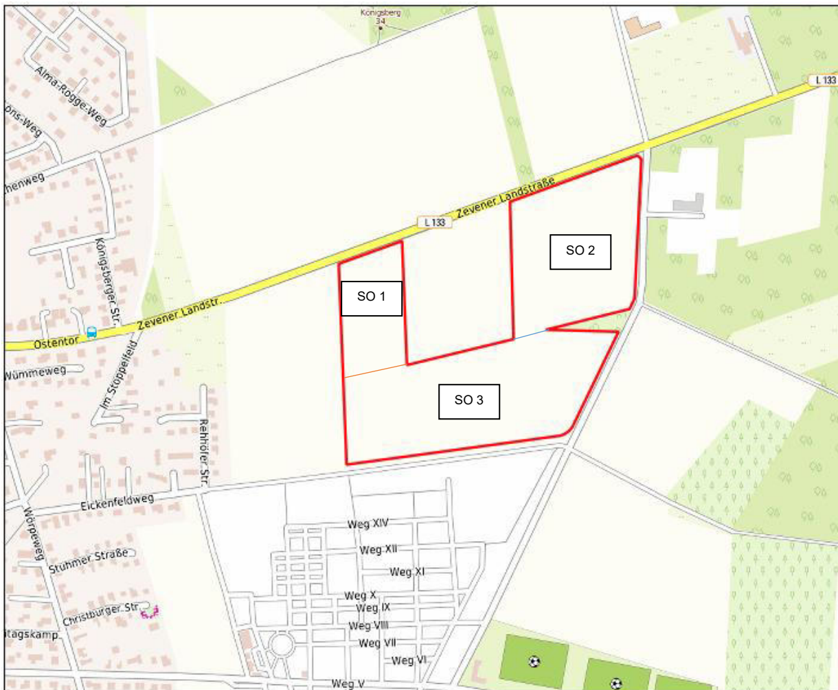
Abb. 1: Übersicht über die Lage der geplanten FF-PVA (ohne Maßstab). Datengrundlage: Top-PlusOpen P50 © GeoBasis-DE

Die Größe des Geltungsbereichs der vorliegenden Planung beläuft sich auf rd. 13,55 ha, wovon 13,51 ha der Nutzung als Sondergebiet „Photovoltaik“ ausgewiesen werden sollen. Weitere knapp 0,04 ha fallen auf einzurichtende Verkehrsflächen zur Erschließung.